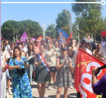
Manifestations contre les coupes budgétaires dans le social et le médico-social