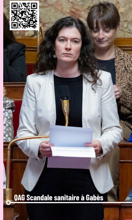
QAG Scandale sanitaire à Gabès

Enfin, j'ai interrogé le gouvernement sur la complicité de la France dans le scandale sanitaire et environnemental à Gabès, en Tunisie .