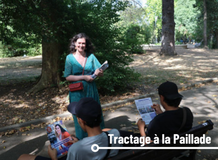
Tractage à la Paillade