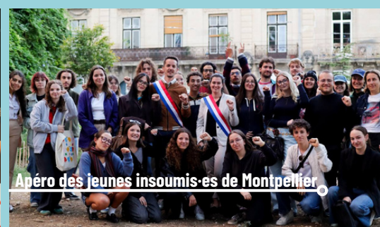
Apéro des jeunes insoumis-es de Montpellier