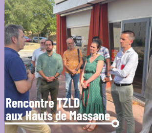
Rencontre TZLD aux Hauts de Massane