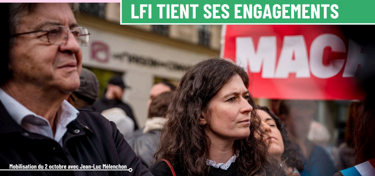
Mobilisation du 2 octobre avec Jean-Luc Mélenchon

Cette année, en tant que députée de La France insoumise, j'ai veillé à tenir fidèlement les engagements que j'ai pris devant les électeurs et électrices, sur la base du programme de rupture clair et assumé du Nouveau Front Populaire. Avec mon groupe parlementaire, j'ai voté toutes les motions de censure pour marquer mon opposition déterminée à la politique du gouvernement . J'ai également voté contre le budget et le budget de la Sécurité sociale présentés par le Premier ministre Sébastien Lecornu, des budgets injustes et déconnectés des urgences sociales et écologiques .