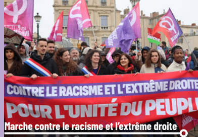
Marche contre le racisme et l'extrême droite