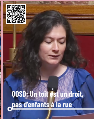
QOSD: Un toit est un droit, pas d'enfants à la rue