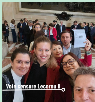
Vote censure Lecornu II

Tout au long de l'année, j'ai occupé mon mandat à défendre la voix et les aspirations de celles et ceux qui m'ont élue pour battre le macronisme et balayer l'extrême droite, comme je continuerai à le faire en 2026.