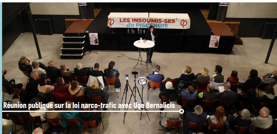
Réunion publique sur la loi narco-traffic avec Ugo Bernalicis