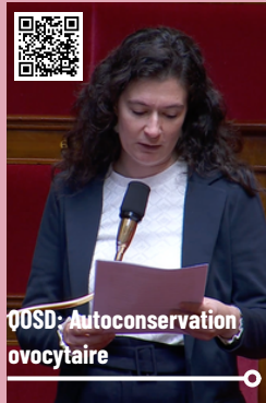
QOSD: Autoconservation ovocytaire

Ces victoires prouvent qu'un autre chemin est possible, grâce à des combats parlementaires constants et assumés.