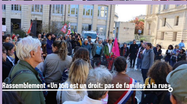
Rassemblement «Un toit est un droit: pas de familles à la rue»