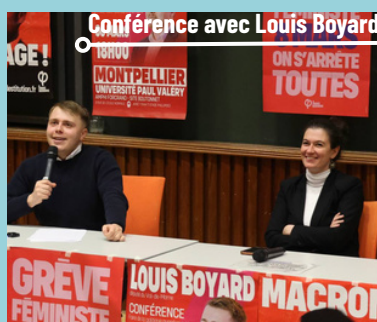
Conférence avec Louis Boyard