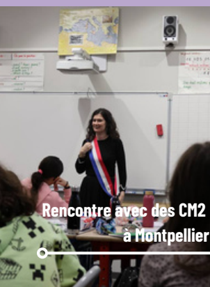
Rencontre avec des CM2 à Montpellier