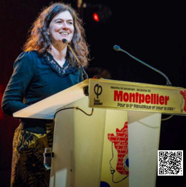
Meeting 6e République avec Manuel Bompard et Pierre-Yves Cadalen