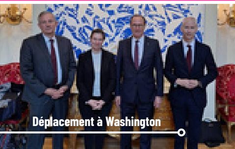
Déplacement à Washington