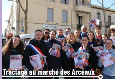
Tractage au marché des Arceaux