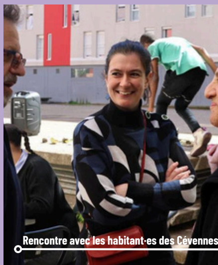
Rencontre avec les habitant-es des Cévennes