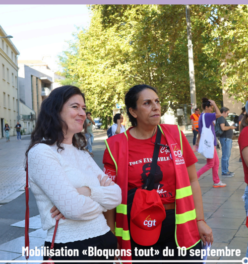
Mobilisation «Bloquons tout» du 10 septembre

Face à cette offensive continue du gouvernement, les rassemblements se sont multipliés : pour défendre les services publics, la retraite à 60 ans, pour l'abrogation de la loi Duplomb, pour une justice sociale et climatique, pour la fin des grands projets inutiles comme l'A69 en Occitanie, mais aussi pour plus de justice fiscale, une taxation des ultra-riches et des moyens donnés aux secteurs médico-social, culturel, éducatif. Il y a une aspiration du peuple à construire une société plus juste, plus écologique et humaniste.