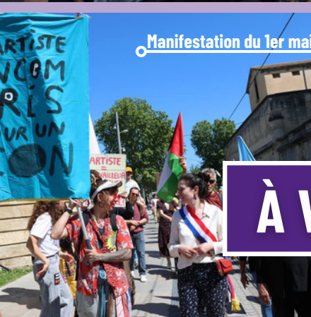
Manifestation du 1er mai