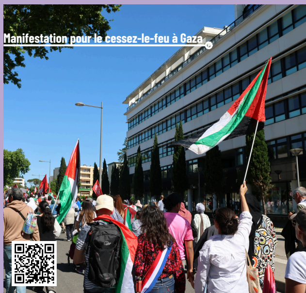
Manifestation pour le cessez-le-feu à Gaza